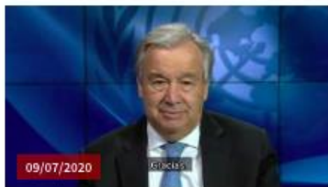
Mensaje del Secretario General ONU. Informe sobre efectos del COVID-19 en América Latina y el Caribe