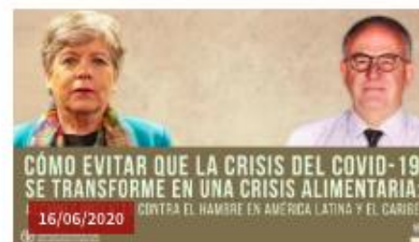
Lanzamiento informe FAO-CEPAL. Cómo evitar que la crisis del COVID-19 se transforme en una crisis alimentaria