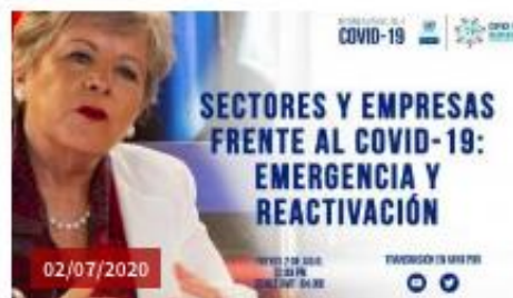
Lanzamiento Informe COVID-19 No.4: Sectores y empresas frente al COVID-19: emergencia y reactivación