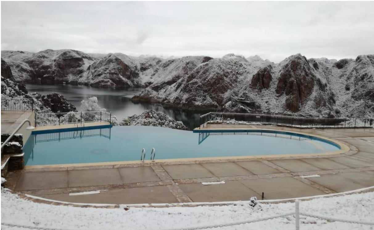
CENTRO TECNOLÓGICO LOS REYUNOS – INVERNO 2018