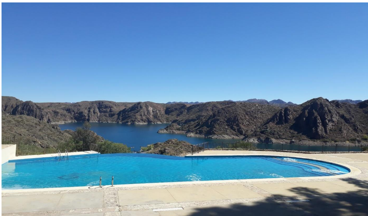
CENTRO DE DESAROLLO REGIONAL LOS REYUNOS – SAN RAFAEL