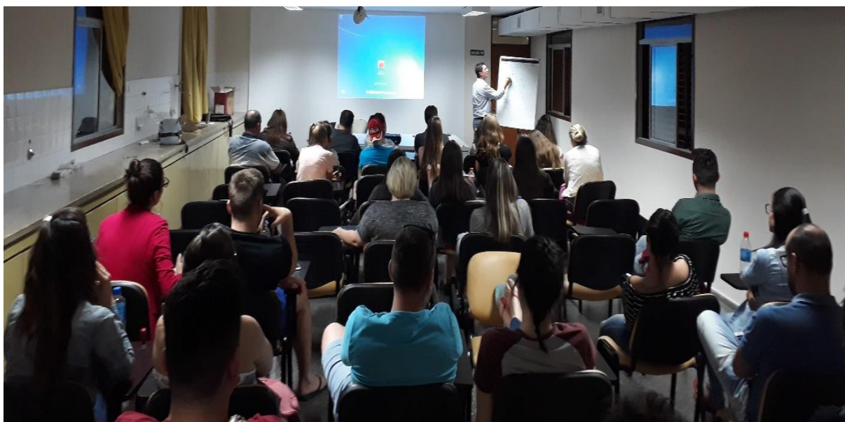
AULA – LOS REYUNOS