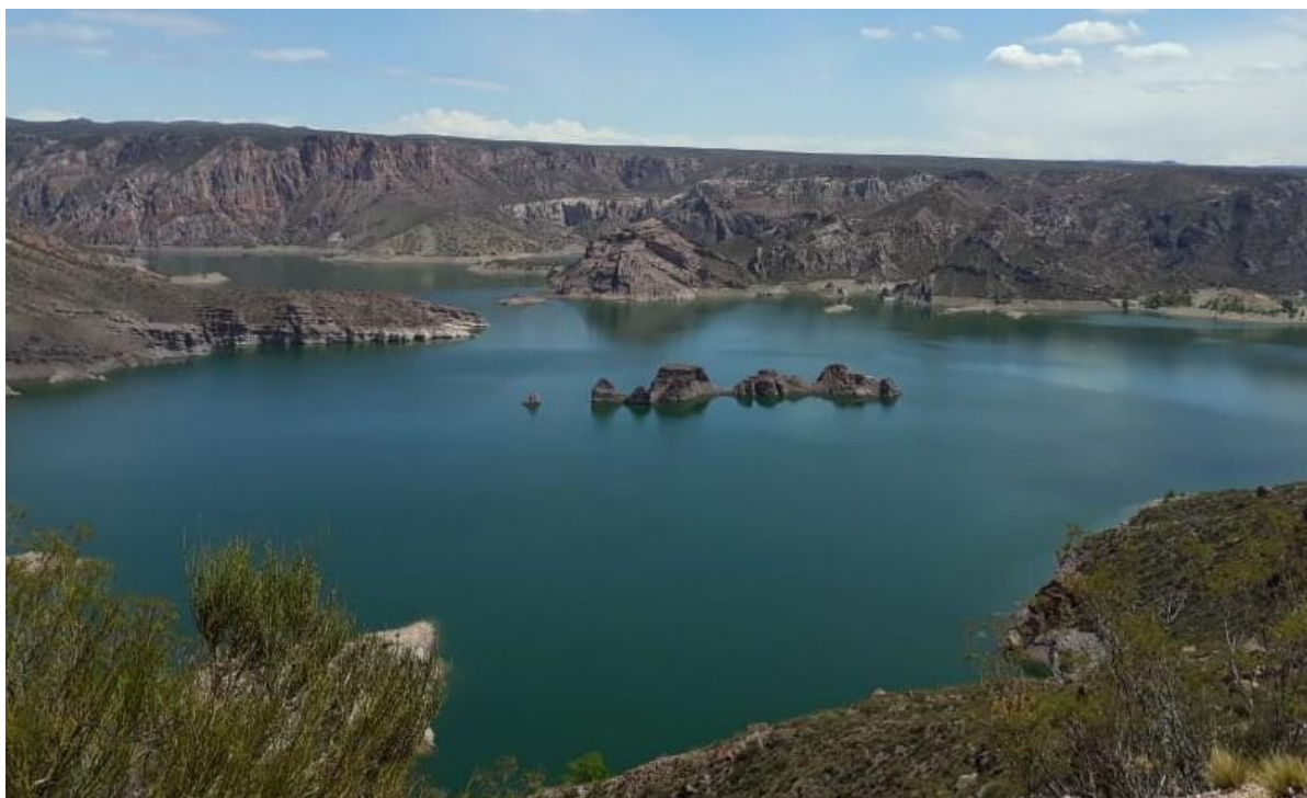
EL SUBMARINO – VALLE GRANDE/SAN RAFAEL