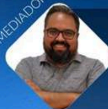
ADM. FELIPE BAPTISTA DE LEÃO