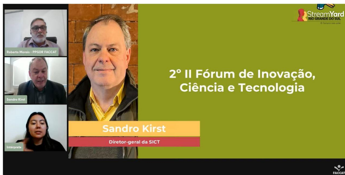
II Fórum de Inovação, Ciência e Tecnologia (II FICT) - 31/10 (manhã)

O II Fórum de Inovação, Ciência e Tecnologia (FICT), realizado entre os dias 31 de outubro e 1º de novembro, se consolidou como um espaço de debate e troca de conhecimentos sobre as principais tendências em inovação, com ênfase no desenvolvimento regional e nas soluções tecnológicas para desafios sociais e econômicos. O evento contou com a participação de 33 autores, 7 avaliadores e 8 mediadores, representando 6 instituições de ensino, e foi marcado pela apresentação de 17 artigos, que serão publicados nos Anais do Fórum.