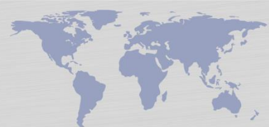
Figura 1 – Projetos desenvolvidos na UNIFESSPA – Campus de Xinguara-PA