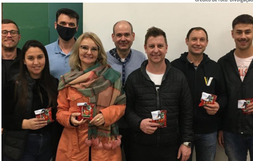
Acadêmicos do curso de Gestão Comercial ganhando um mimo da coordenação

Dia 4 de junho foi comemorado o dia do Gestor Comercial e a coordenação do curso entregou um pequeno mimo para os alunos. Mas você sabe qual é o campo de atuação desta profissão?