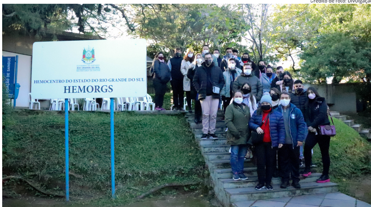
Colaboradores do projeto em frente ao Hemocentro do Rio Grande do Sul, em Porto Alegre, no dia 11 de junho