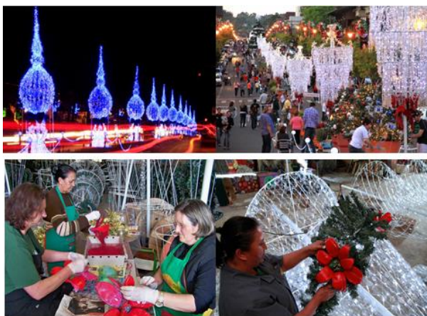
Figura 05- Enfeite com Utilização de Garrafas Pet

escolas do município na arrecadação de garrafas para serem transformadas em enfeites de Natal.