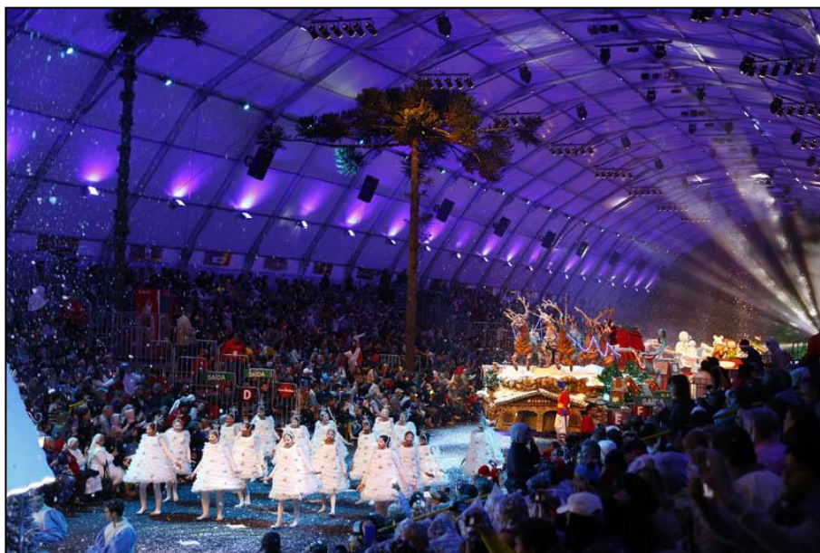
Figura 02- Grande Desfile de Natal no Desfilódromo

O Grande Desfile de Natal surgiu no ano de 2001 junto com o espetáculo Nativitaten. Esses espetáculos foram criados com o objetivo de alavancar e tornar o evento nacionalmente conhecido. Consoante Generosi (2011), esta atração foi inspirada nas PARADAS DA DISNEY. Para a criação desse espetáculo foi contratado um dos principais artistas carnavalescos da época, Joãozinho Trinta e sua equipe. O Grande Desfile de Natal é composto por um show de som, luz, alegorias, bailarinos, patinadores, atores e acrobatas. É um espetáculo leigo, divertido e ancorado em cenas múltiplas medievais. O grande cortejo é composto por 400 integrantes em seu elenco.