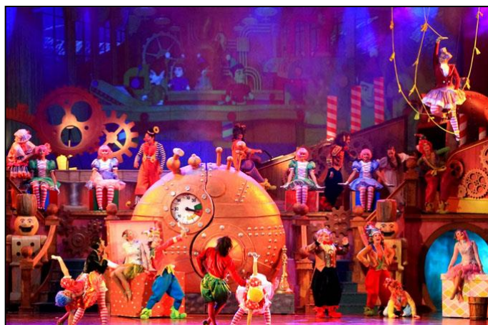
Figura 03- Fantástica Fábrica de Natal

Em 2006 estreou o espetáculo Fantástica Fábrica de Natal, um musical em forma de teatro, que conta a história de duas crianças que adormecem e passam a conhecer o incrível mundo da imaginação, um local onde são fabricados todos os brinquedos que o Papai Noel distribui no natal.