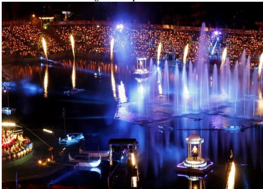
Figura 01- Espetáculo Nativitaten